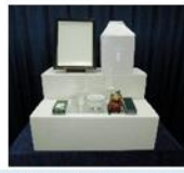
後飾り祭壇・仏具